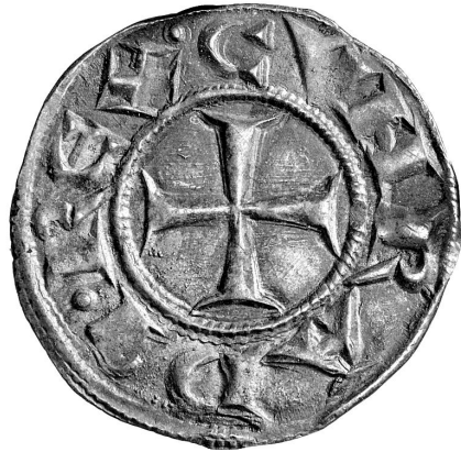
↑ Fig. 3. Simboli e legende su un denaro grosso, inv. 5970, Civiche Collezioni Numismatiche, Musei di Strada Nuova, Genova.