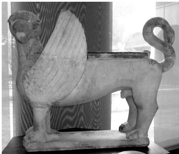
Fig. 8 - Grifone in marmo del Maestro di Gianno, 1307-1312, Genova, Museo di S. Agostino, inv. MSA 3424.