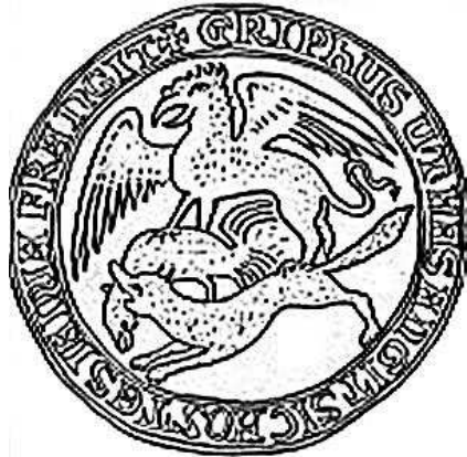
Fig. 10 - Ricostruzione grafica di sigillo con aquila, grifone e volpe, da sigillo genovese in cera verde, Archivio di Montpellier, 1193 circa.