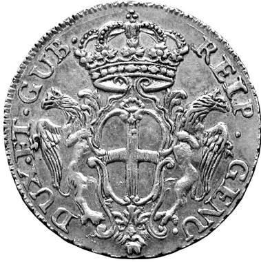
Fig. 2 - 100 lire 1758, diritto con lo stemma di Genova.