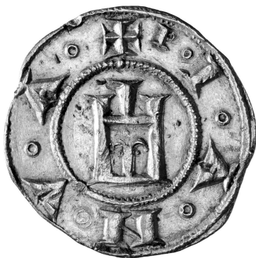
Fig. 6 - Stilizzazione della città turrata sul diritto di un genovino, inv. 6001, Civiche Collezioni Numismatiche, Musei di Strada Nuova, Genova.