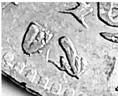
Fig - 15. Simbolo dell'ancoretta, identificante la zecca di Genova su una moneta sabauda.