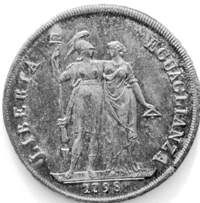
Fig. 13 - Personificazione della Libertà e dell'Eguaglianza nelle monete da 8 lire del 1798, inv. MAR 2936, Civiche Collezioni Numismatiche, Musei di Strada Nuova, Genova.