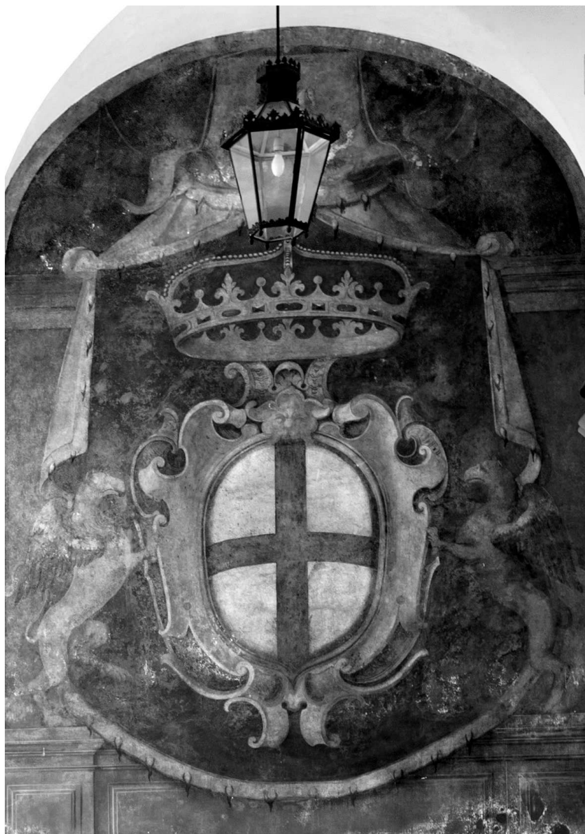
Fig. 1 - D. Fiasella, Arma della Repubblica di Genova, affresco, Genova, Palazzo Ducale.