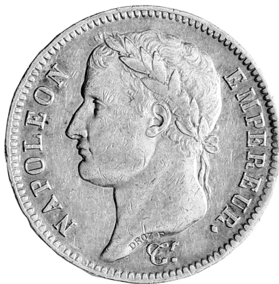
Fig. 14 - Testa di Napoleone sulle monete da 20 franchi coniate dalla zecca di Genova, Collezione d'arte di Banca Carige, inv. 1031.