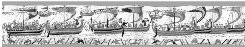
Fig. 5 - Particolare dell'arazzo di Bayeux, Bayeux, Musée de la Tapisserie.