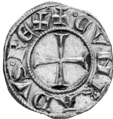
Fig. 4 - Simbolo cristiano della croce su un genovino, inv. 6001, Civiche Collezioni Numismatiche, Musei di Strada Nuova, Genova.