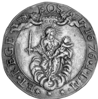
Fig. 12 - La Madonna Regina di Genova rappresentata su uno scudo della Repubblica, inv. 7119, Civiche Collezioni Numismatiche, Musei di Strada Nuova, Genova.