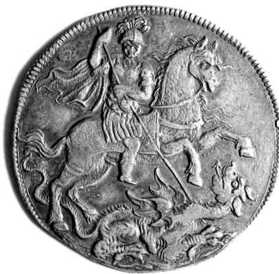
Fig. 11. Moneta da 6 reali del 1666, come tutta la serie riporta sul rovescio l'immagine di S. Giorgio, Collezione d'arte di Banca Carige, inv. 649.