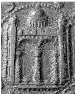
Fig. 7 - Città turrata, particolare sul diritto di un sigillo del Comune, collezione privata.